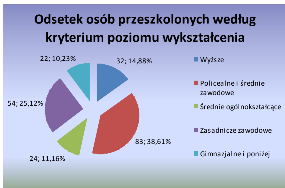
Wykres 2. Odsetek osób przeszkolonych według kryterium poziomu wykształcenia.

Z ogólnej liczby przeszkolonych osób bezrobotnych i poszukujących pracy najwyższy udział procentowy, na poziomie 38,61%, tj. 83 osób – stanowiły osoby przeszkolone z wykształceniem policealnym i średnim zawodowym. Najniższy odsetek na poziomie 10,23% odnotowano w odniesieniu do osób z wykształceniem gimnazjalnym i poniżej.