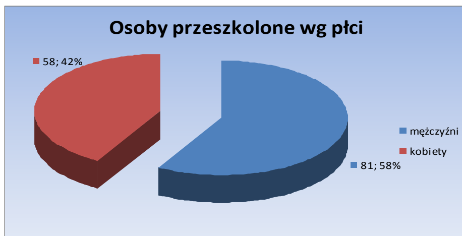
Wykres 1. Liczba i odsetek osób przeszkolonych według kryterium płci.